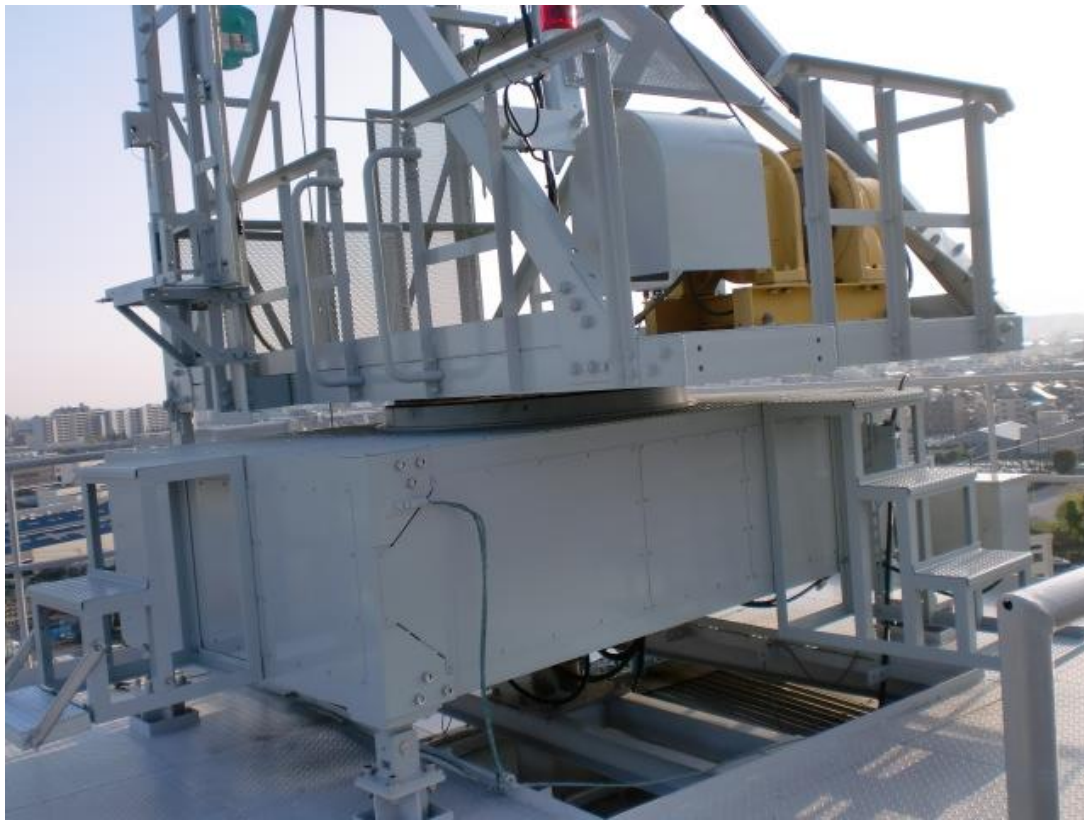
傾斜型 2 軸測定用回転装置(KMP40-2 型)