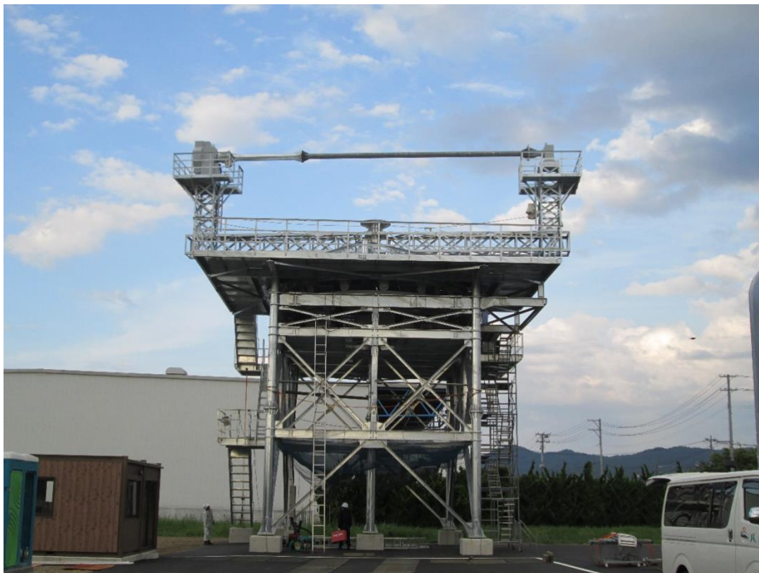
横回転型 2 軸測定用回転装置(KMP-250 型)