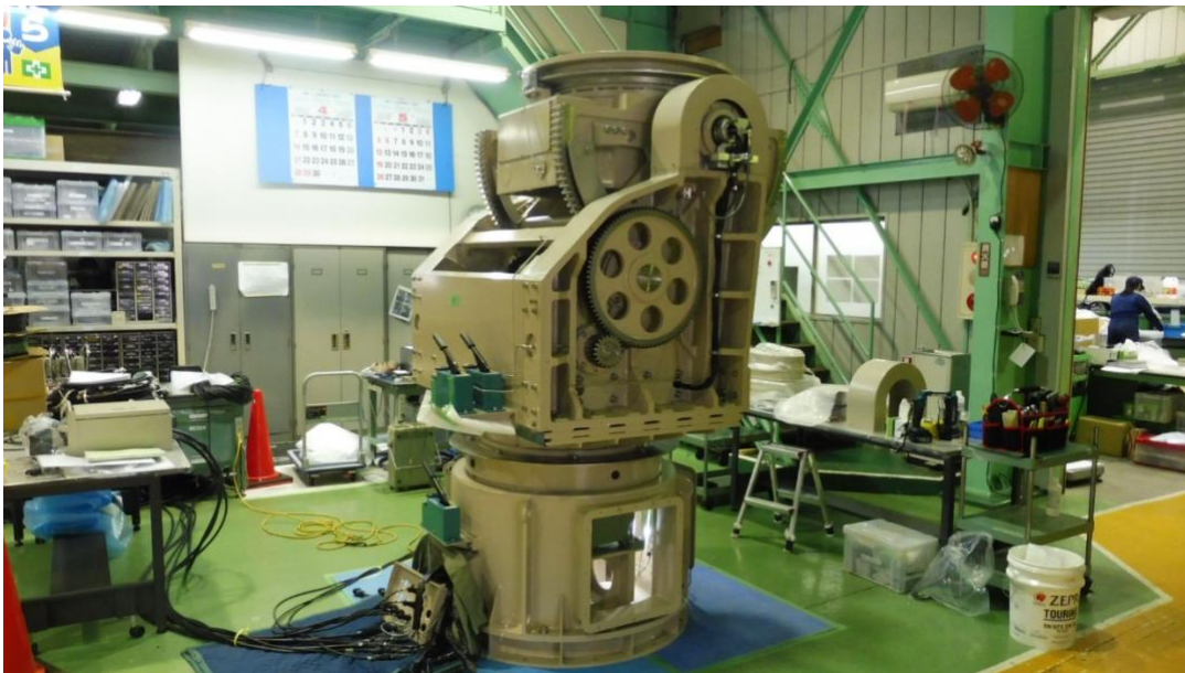
製作中の 3 軸アンテナ測定用回転装置(KM-5000A 型)