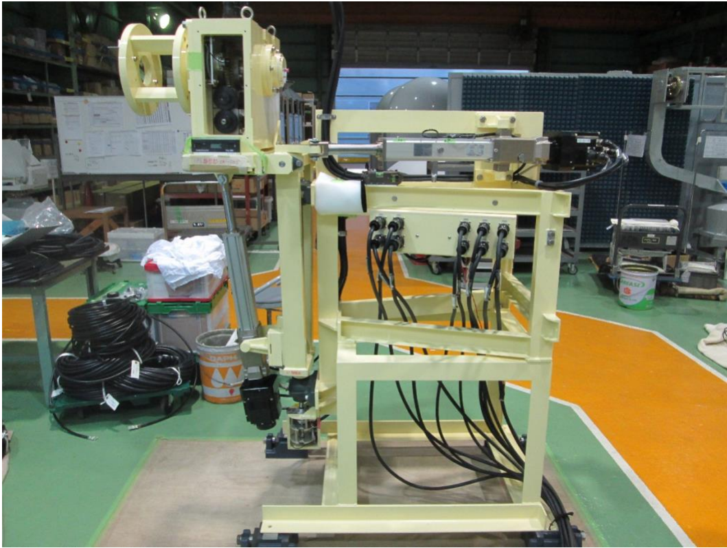
アンテナ測定用高所車両搭載 3 軸測定用回転装置(KMP24-1X 型)