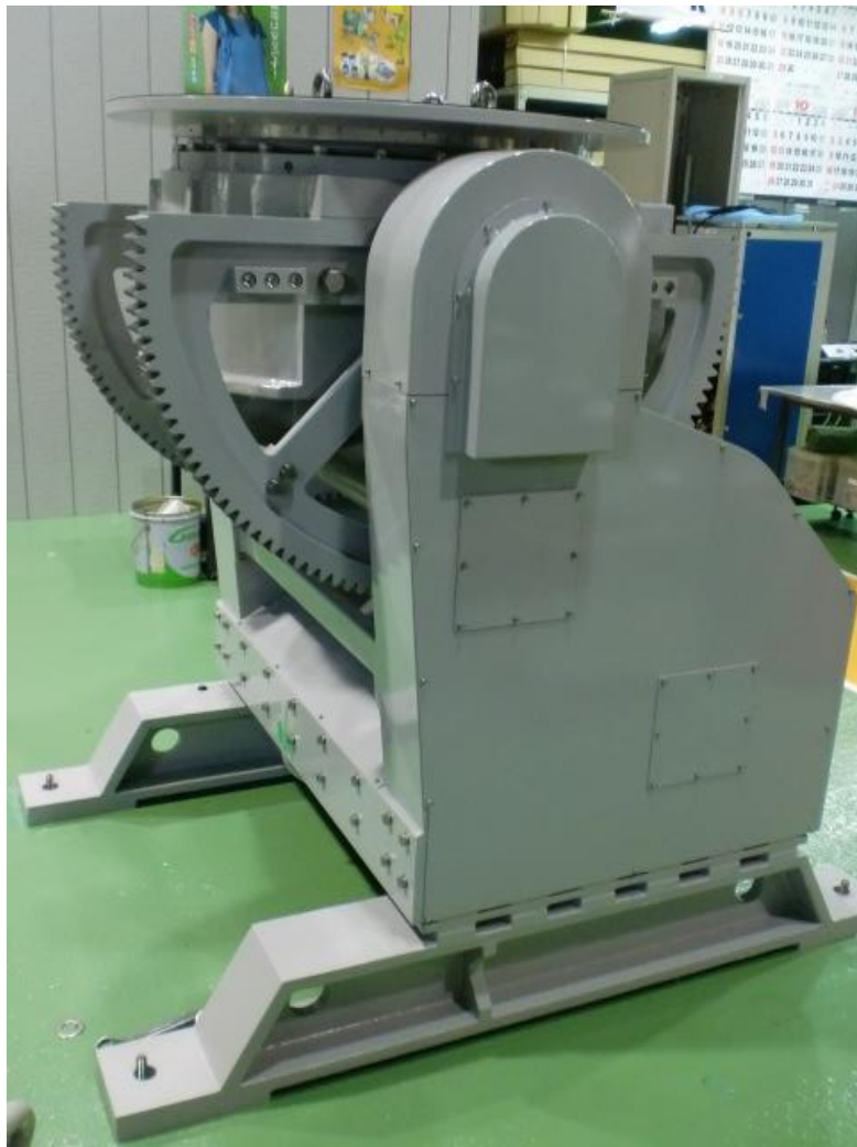
屋内用重量負荷搭載 2 軸測定用回転装置 (KMP50-2X 型)