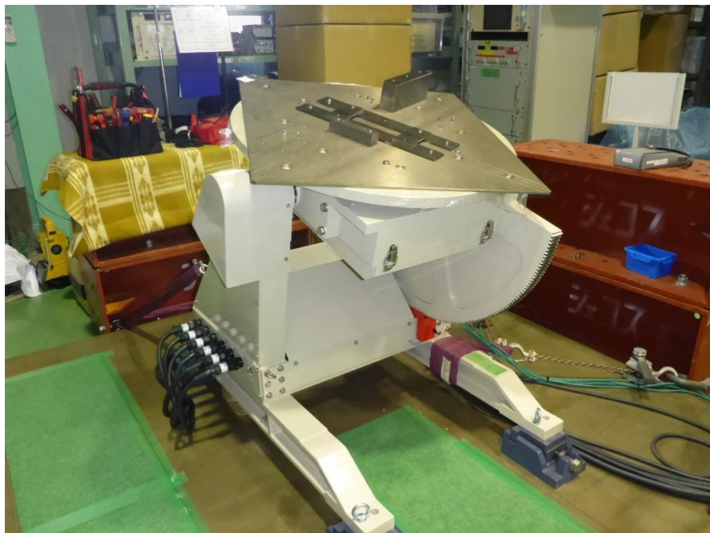
屋内用軽量負荷搭載 2 軸測定用回転装置(KMP03-1X 型)